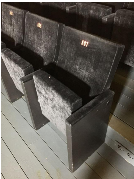
Detalle de butacas de las otras salas de Cineteca

La capacidad del graderío retráctil será de unas 120 butacas aproximadamente (el nº exacto dependerá del modelo concreto de butaca y del tipo de graderío retráctil ofertado por el adjudicatario.)