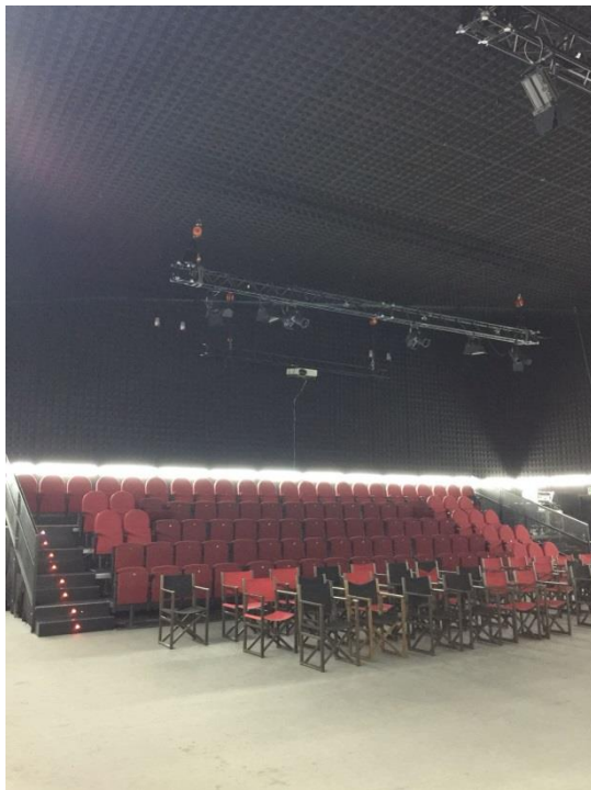
Graderío no retráctil y sillas adicionales